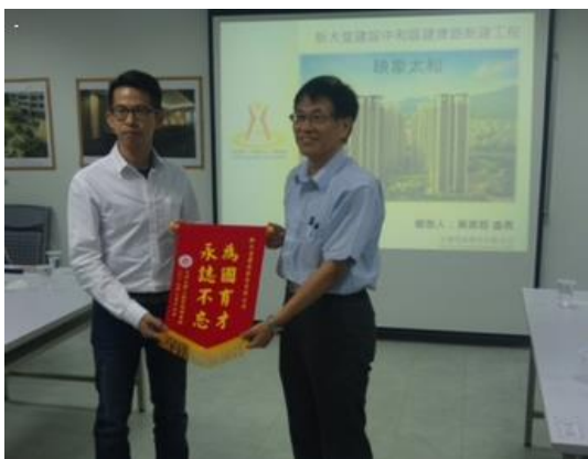
105 學年互助營造映象太和預鑄工法及材料運籌管理參訪