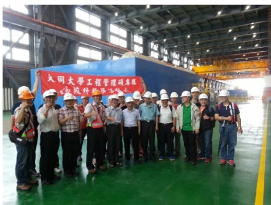
105 學年台電林口火力發電廠參訪