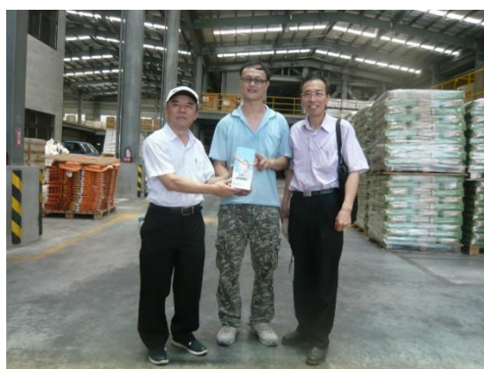
104 學年南星顏料自動化管理參訪引進德國自動化設備製程原料庫存品質管理