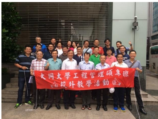
105 學年校外參訪活動啟程